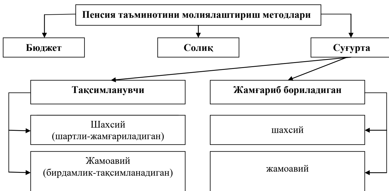
2-расм. Пенсия таъминотини молиялаштириш методлари(Борисенко, 2007)

Дастлаб, шахсий пенсия таъминоти ишчилар ва ўзини-ўзи банд қилган шахслар томонидан давлат пенсия таъминоти томонидан тақдим этиладиган пенсия миқдорининг камлиги сабаб, ўз маблағларини жамғариб бориши ҳисобига шаклланди. Ривожланиши эса иккинчи жаҳон урушидан кейинги даврда ривожланган мамлакатларда иш ҳақининг ўсиш суръати сезиларли даражада ошиши натижасида содир бўлди. Шахсий пенсия таъминоти бугунги кунда Буюк Британия ва Даниянинг пенсия таъминоти тизимида муҳим рол ўйнайди. Данияда мазкур тизимда иштирок этиш ихтиёрий ҳисобланса, Буюк Британияда умуммиллий ёки корпоратив пенсия таъминотида қатнашмайдиган ҳар бир шахс учун мажбурий характерга эга.