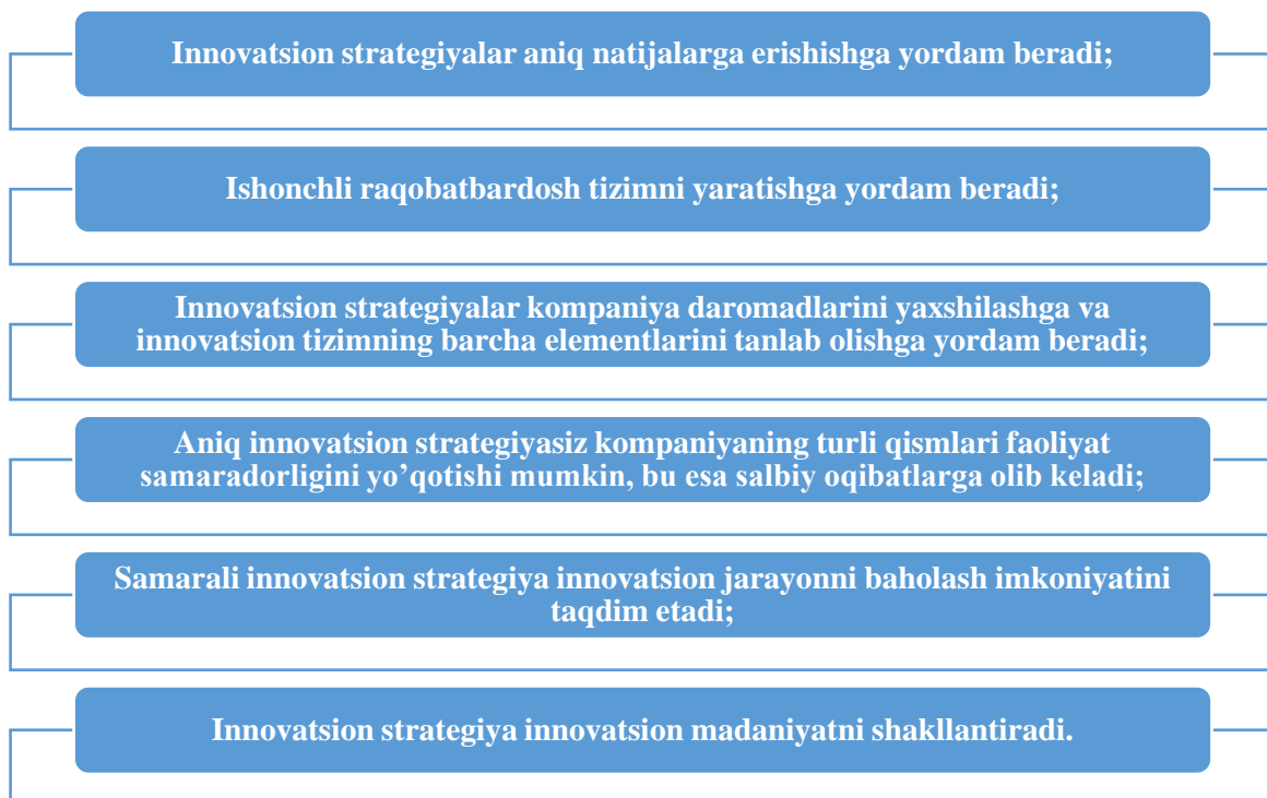
2-rasm. Innovatsion strategiyaning o'ziga xos xususiyatlari [11]

uchun resurslardan foydalanish, raqobat sharoitida ustunlikni yaratish bo'yicha qarorlar qabul qilishga yordam beradi. Quyida innovatsion strategiyaning o'ziga xos xususiyatlarini keltirib o'tamiz (2-rasm).